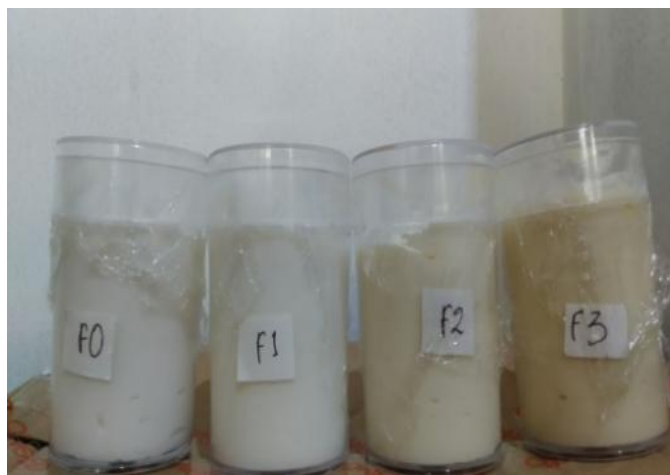
Gambar 1. Hasil Formulasi Krim Tabir Surya yang Mengandung Ekstrak Etanol Umbi Bengkuang

Hasil uji organoleptik pada Tabel 3 menunjukkan hasil yang stabil, dengan satu formula menunjukkan ketidakstabilan dalam hal bentuk fisik, warna, dan aroma setelah 14 hari penyimpanan pada suhu ruang (20-25°C).